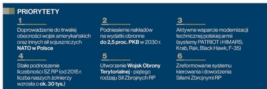
Rys. 2. Priorytety w zakresie działań na rzecz zwiększenia bezpieczeństwa państwa.

Aktywną politykę obronną i budowanie trwałego bezpieczeństwa ukazuje w układzie chronologicznym rys. 3.