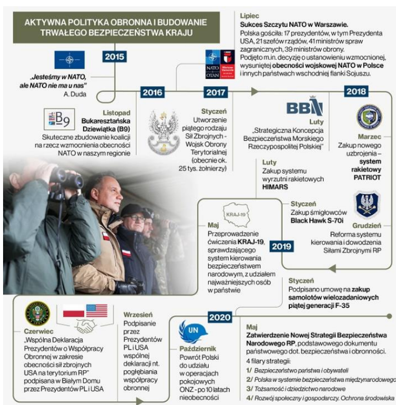
Rys. 3. Chronologiczne ujęcie aktywności politycznej w zakresie budowania trwałego bezpieczeństwa w naszym kraju.

Aktywną politykę obronną i budowanie trwałego bezpieczeństwa ukazuje w układzie chronologicznym rys. 3.